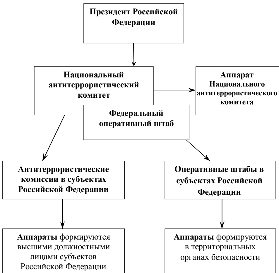
Рисунок 3 – Схема координации деятельности по противодействию терроризму в Российской Федерации