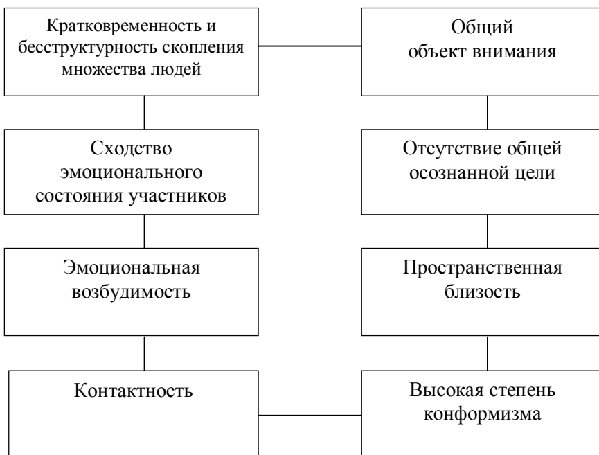
Рисунок 2 – Психологические свойства толпы