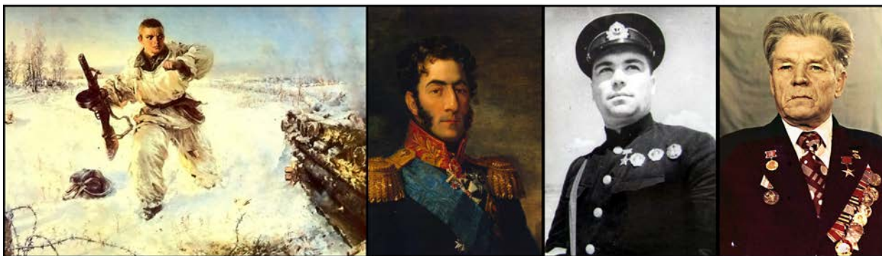
ГЕРОЙ-ЖЕРТВА БРОСАЕТСЯ НА АМБРАЗУРУ

В Советском Союзе были учреждены звания Героя Советского Союза и Героя Социалистического Труда . Героем можно было стать в мирных делах, а не только во время конфликтов и войн. Недаром великие мыслители говорили: «Храбрость нужна не только в битвах, но и в простых житейских делах»; «Отвага людская больше познаётся в малом, нежели в великом». Но не всякий смелый поступок можно назвать героическим. Храбрый, отважный, смелый человек — это ещё не герой. Герои – это люди с большой буквы, подвижники в новое, ещё неизведанное человечеством. Героически поступают люди, которые в любых тяжёлых условиях хранят внутри себя честь и порядочность, чувство дружбы и человеколюбия, являются носителями сильного духа и воли.