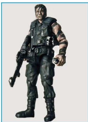
СОЛДАТИК ДЖИ АЙ ДЖО